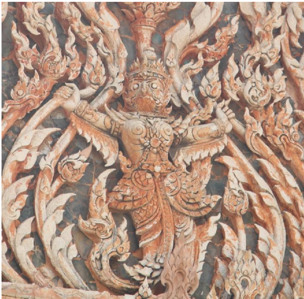
ภาพที่ 1 ภาพครุฑ วัดเขาน้ำไดอิฐ จังหวัดเพชรบุรีต้นแบบความเหมาะสม ที่มา : ภาพถ่ายโดย สยมภู เทียนสุวรรณเมื่อวันที่ 27 เดือน กุมภาพันธ์ พ.ศ. 2559