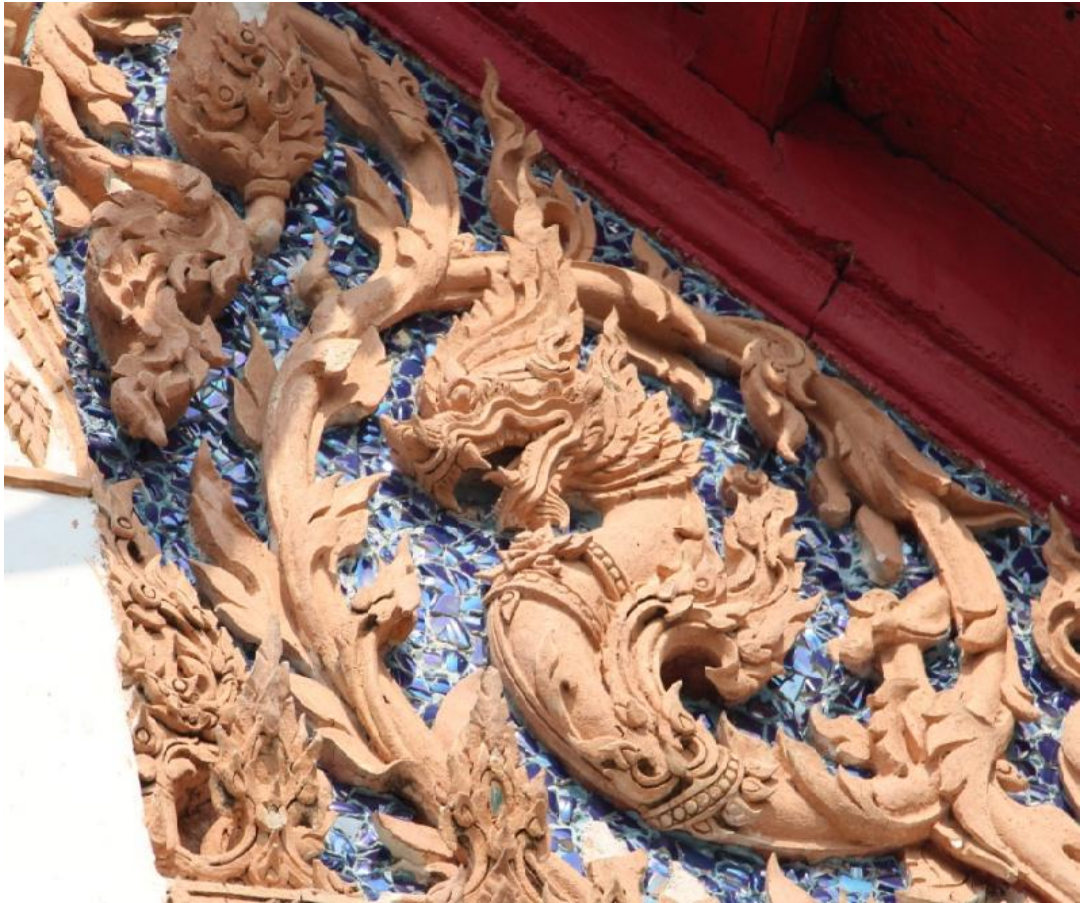
ภาพที่ 4 เทคนิคการประดับกระຈก วัดเขابقไดอัฐ จังหวัดเพชรบุรี ที่มา : ภาพถ่ายโดย สยมภู เทียนสุวรรณเมื่อวันที่ 27 เดือน กุมภาพันธ์ พ.ศ. 2559

ตอนที่ 2เป็นการนำเอกลักษณ์เฉพาะของสกุลช่างเพชรบุรี ทั้งด้านวัสดุ และรูปแบบของการสร้างสรรค์งานปั้นปูนสดสกุลช่างเพชรบุรี มาใช้ในการออกแบบตกแต่งผลิตภัณฑ์สาธารณะเพื่อสร้างอัตลักษณ์จังหวัดเพชรบุรีซึ่งประกอบด้วย เสาไฟประติมากรรม และป้ายบอกชื่อซอย