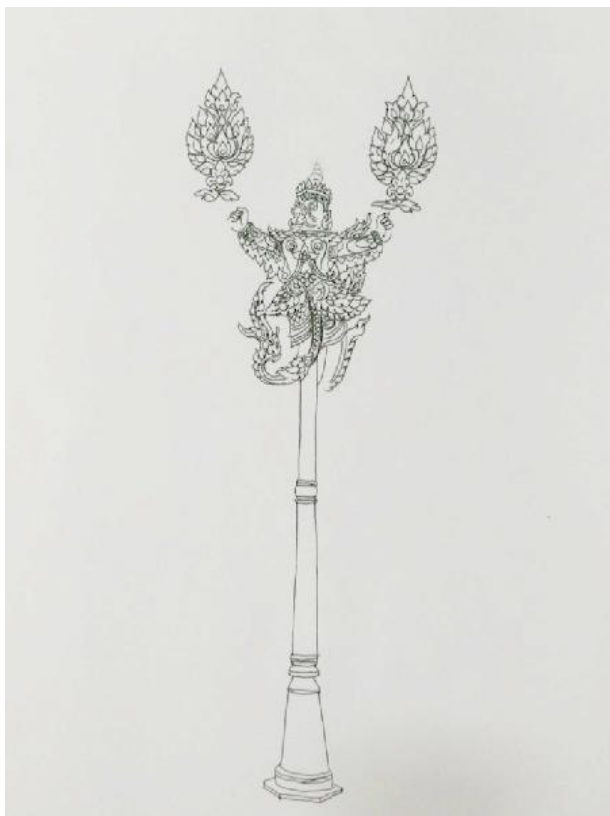
ภาพที่ 9 แบบร่างเสาไฟประติมากรรมแบบที่ 2 ที่มา : ภาพร่างโดย นภดล สว่างลเพชรเมื่อวันที่ 10 เดือน พฤษภาคม พ.ศ. 2559

เป็นการนำลายช่อหางโต มาประกอบกับครุฑในท่วงท่าที่แสดงถึงความสมมาตร ลดลายช่อหางโตให้เหลือเพียง 2 ช่อ เพื่อลดทอนรายละเอียด และแสดงความชัดเจนของครุฑได้มาก