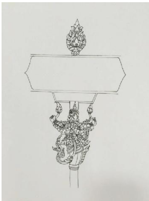
ภาพที่ 6 ภาพแบบร่างป้ายบอกชื่อยแบบที่ 1 ที่มา : ภาพร่างโดย นภดล สังวาลเพชรเมื่อวันที่ 10 เดือน พฤษภาคม พ.ศ. 2559

วารสารสวนสุนันทาวิชาการและวิจัย Suan Sunandha Academic & Research Review