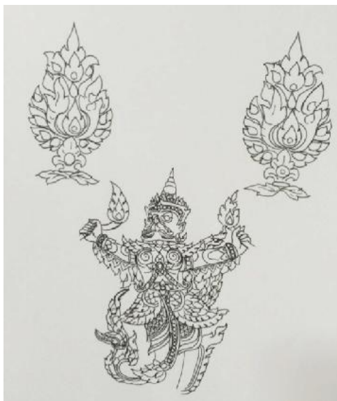
ภาพที่ 5 ภาพแบบร่างที่ 1

วารสารสวนสุนันทาวิชาการและวิจัย Suan Sunandha Academic & Research Review