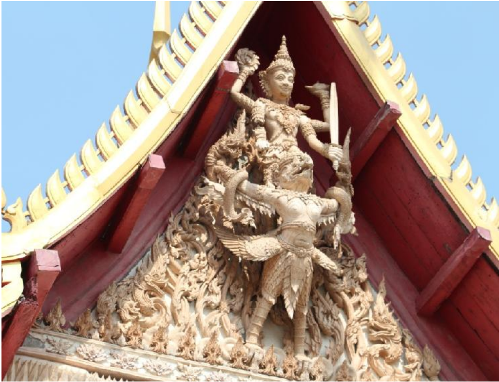
ภาพที่ 3 ภาพรูปแบบตัวทึบลาย วัดเขabanไดอิฐ จังหวัดเพชรบุรี

เมื่อวันที่ 27 เดือน กุมภาพันธ์ พ.ศ. 2559