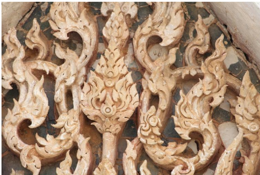
ภาพที่ 2 ภาพรูปแบบการปั้นที่มีลักษณะพลิกพลิ้ว วัดเขาบันไดอิฐ จังหวัดเพชรบุรีเมื่อวันที่ 27 เดือน กุมภาพันธ์ พ.ศ. 2559