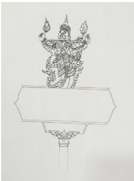
ภาพที่ 7 ภาพแบบร่างป้ายบอกขอบแบบที่ 2 ที่มา : ภาพร่างโดย นภดล สังวาลเพชรเมื่อวันที่ 10 เดือน พฤษภาคม พ.ศ. 2559

วารสารสวนสุนันทาวิชาการและวิจัย Suan Sunandha Academic & Research Review