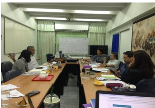
ภาพที่ 4 ประชุมคัดเลือกศิลปกรรมปูนปั้น