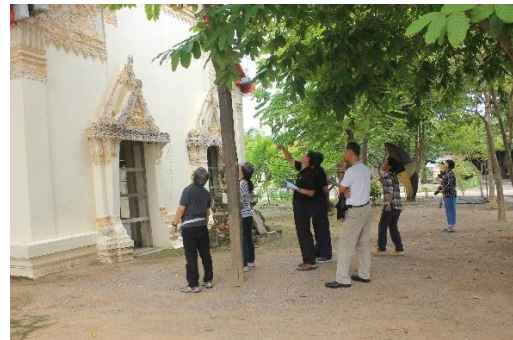
ภาพที่ 3 สำรวจศิลปกรรมปูนปั้น