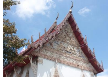
ภาพที่ 6 แหล่งปูนปั้นที่คัดเลือกตามเส้นทางท่องเที่ยว (เส้นทางที่ 1 – 3)