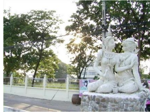
ภาพที่ 7 แหล่งปูนปั้นเส้นทางท่องเที่ยวถนนราชดำเนิน (เส้นทางที่ 4)