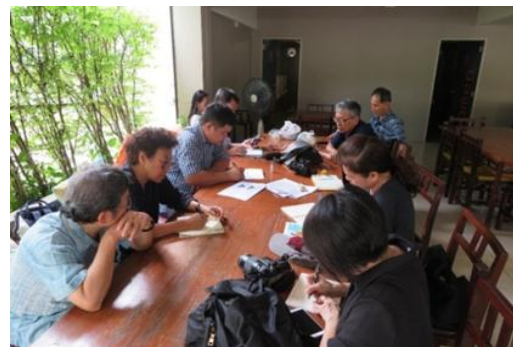
ภาพที่ 5 ประชุมคัดเลือกศิลปกรรมปูนปั้น