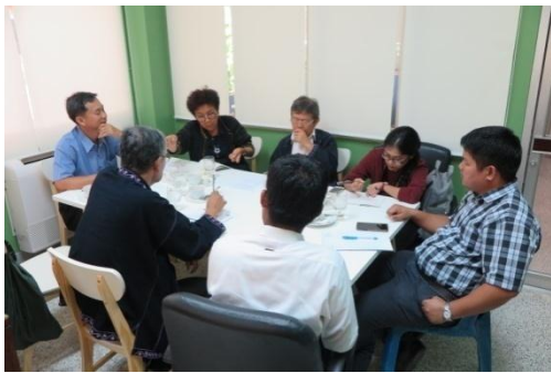
ภาพที่ 2 สัมภาษณ์ผู้รู้ด้านศิลปวัฒนธรรม

4.2) ปรับปรุงเส้นทาง คู่มือท่องเที่ยว และแอปพลิเคชันเส้นทางท่องเที่ยวทั้ง 4 เส้นทาง การดำเนินการวิจัยเรื่อง การพัฒนาเส้นทางท่องเที่ยวเพื่อการเรียนรู้งานศิลปกรรมปูนปั้นเมืองเพชร กิจกรรมแต่ละขั้นตอน ดังแสดงในภาพที่ 2 – ภาพที่ 7