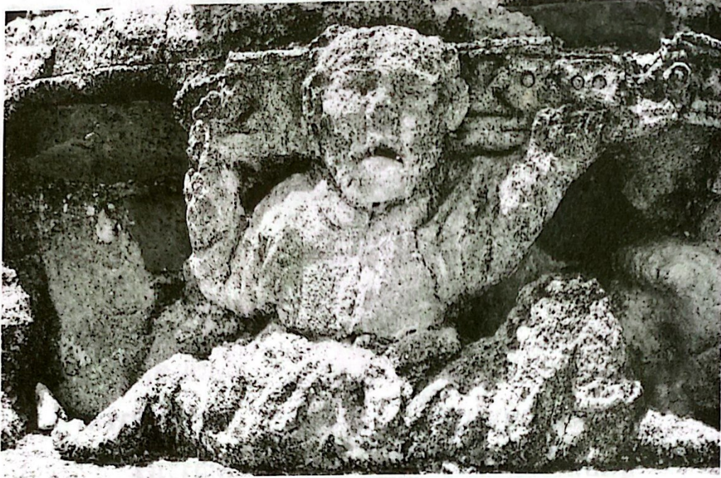
ปูนปั้นปริศนา ฐานเสมา วัดสระบัว (รูปแรก)

รูปยักษ์ หรือรูปครุฑตามคตินิยม คล้ายว่าบรมครูผู้ปั้นแฉ่งปริศนาอย่างใดอย่างหนึ่ง บอกเรื่องราวในอดีตให้คนชั้นหลังได้รับทราบอะไรบางประการหรือไม่