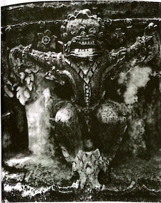
ปูนปั้นยักษ์ ฐานเสมา วัดสระบัว

สมเด็จพระเจ้าทรงธรรม สมเด็จพระเชษฐาธิราช สมเด็จพระเจ้าปราสาททอง ออกหลวงมงคล หรือออกญาเกล้าโหม