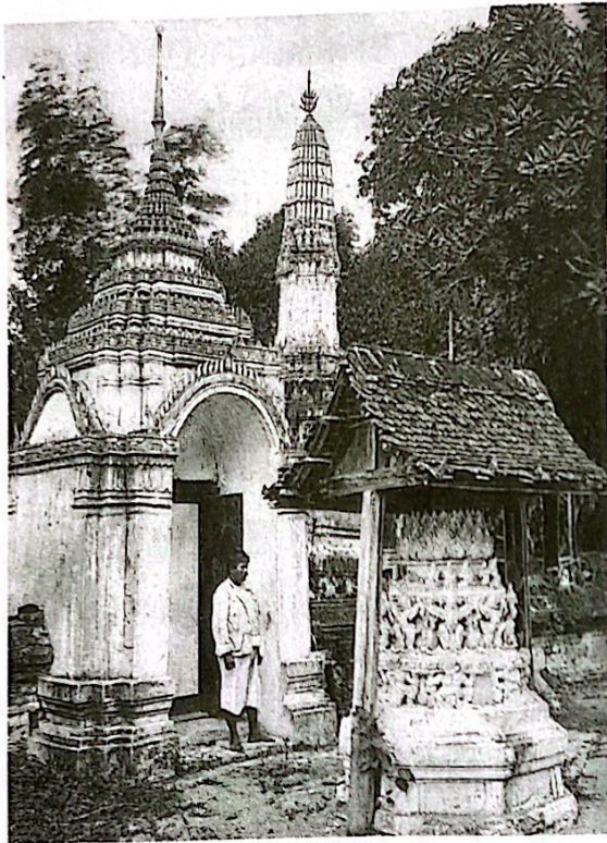
ภาพจากหนังสือ Buddistische Tempelangan in Siam ของ คาร์ล ดอห์ริง พิมพ์เมื่อสมัย ร.6 พ.ศ.2463 ทอสมุดแห่งชาติ (สมุดภาพเมืองไทย)