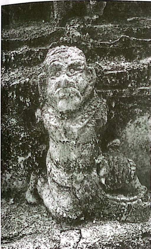
รูปปูนปั้นปริศนา วัดสระบัว อีกตัวหนึ่งเข้าใจว่าเป็นบุคคลสำคัญ ในสมัยกรุงศรีอยุธยา (รูปที่สอง)